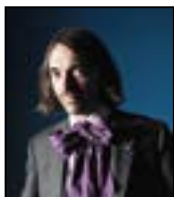
Cédric Villani Mathématicien et député

Cédric Villani est un mathématicien français, ancien élève de l'ENS et docteur en mathématiques, titulaire de la Médaille Fields et lauréat 2014 du prix Doob. Professeur de l'université de Lyon, il a été professeur-invité d'universités étrangères et directeur de l'Institut Henri Poincaré de 2009 à 2017. Il est député de l'Essonne, siège à la commission des Lois et préside l'Office parlementaire d'évaluation des choix scientifiques et technologiques. Membre de l'Académie des sciences, il a publié plusieurs ouvrages dont « Théorème Vivant » traduit en 12 langues.